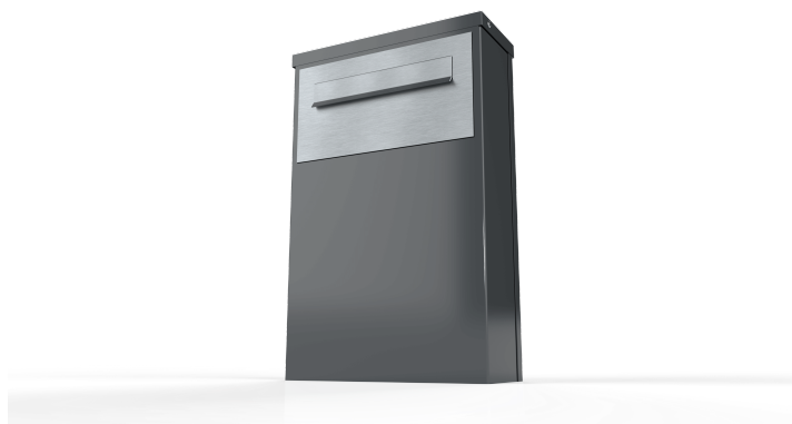
Skrzynka na listy