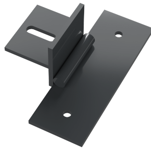
Uchwyt montażowy UM6 OC.+RAL (zawiasowy)